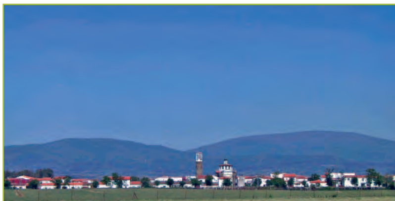
Pedanía de Gata.

La Moheda de Gata, perteneciente al municipio de Gata desde que Felipe II, apremiado por las necesidades de aquella época, vendiera al Concejo de Gata las dehesas de Moheda, Fresno y Jarallana por 7.000 ducados. Como consecuencia de la construcción del pantano de Borbollón en 1.954 surge La Moheda de Gata, pueblo de colonización que riega sus tierras con las aguas de la presa mencionada. Pueblo pequeño y tranquilo situado a muy pocos kilómetros de Moraleja.